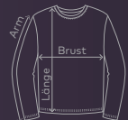
EXCD Men's T-Shirt LS | Seite 10/11 | Waschanleitung: P