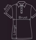
EXCD Women's Polo | Seite 12/13 | Waschanleitung: P