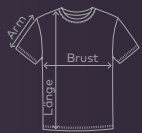
EXCD Men's T-Shirt | Seite 08/09 | Waschanleitung: P