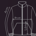
EXCD Women's Sweatjacket | Seite 16/17 | Waschanleitung: P