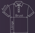
EXCD Men's Polo | Seite 12/13 | Waschanleitung: P