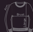
EXCD Unisex Sweater | Seite 14/15 | Waschanleitung: P