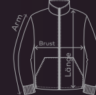
EXCD Men's Sweatjacket | Seite 16/17 | Waschanleitung: P