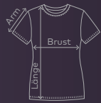
EXCD Women's T-Shirt | Seite 08/09 | Waschanleitung: P