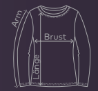
EXCD Women's T-Shirt LS | Seite 10/11 | Waschanleitung: P